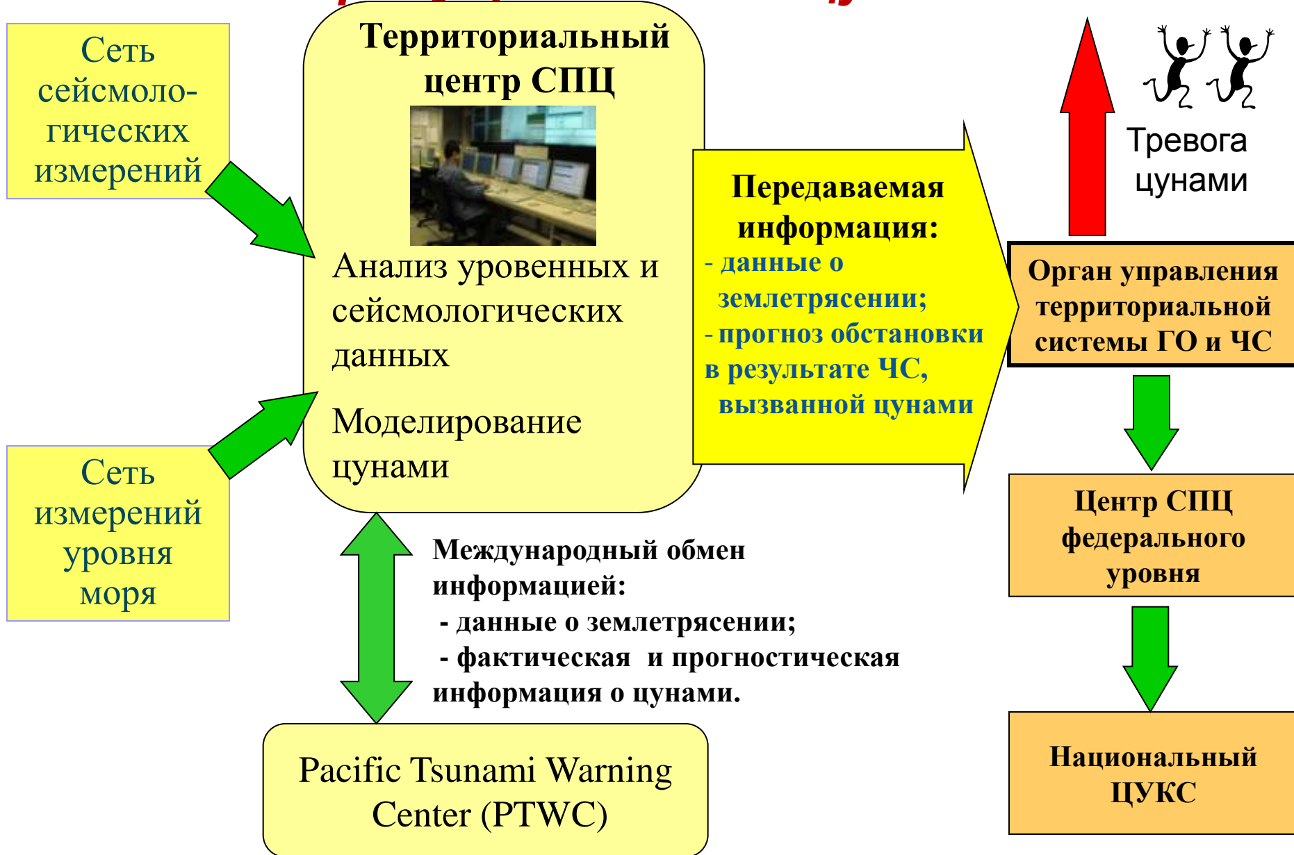
Схема информационного обмена в службе предупреждения о цунами